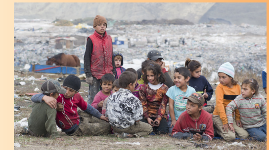
In Rumänien unterstützen wir ein Projekt, bei dem Menschen geholfen wird, die auf einer Mülldeponie leben.

Network: Wir arbeiten am Aufbau eines weltweiten Logistiknetzwerkes, um die Hilfe effizient in unsere Zielländer zu bringen.