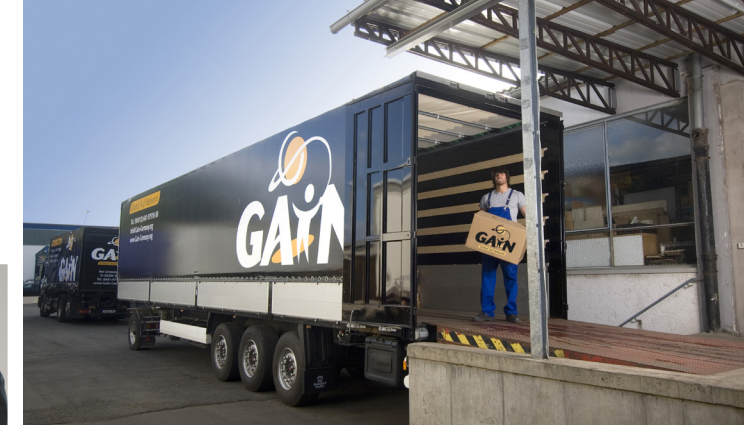
In unserem Logistikzentrum in Gießen werden jede Woche ein bis zwei Hilfstransporte verladen und versandt.